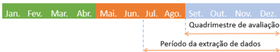
Figura 2. Esquema ilustrativo do período de medição e avaliação do numerador do indicador.